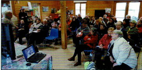
Conférences-débats pour sensibiliser et former les jardiniers amateurs

Ateliers pour les enfants sur les techniques jardinières